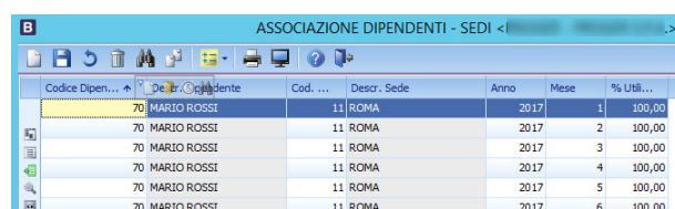
(tabella per associazione dipendenti - sedi)

Secondo la stessa logica è possibile specificare l'appartenenza del dipendente ad una sede (o ripartire la sua presenza in percentuale su più sedi) in modo da utilizzare un sottoconto in contabilità analitica dettagliato per sede (solo per le voci di tipo economico).